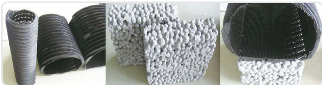
新創填海造地工法部分零件圖示 ( 滲透基層及負壓管 )

世盟國際具有優異的特定領域研發能力及不斷轉型經營的能力，公司深知專利權對於公司產品保障及未來經營擴展的重要性，但公司規模尚小，未能於公司內部配置智財人員，因此智權策略為透過專利事務所協助進行專利評估及申請，2012年5月與本計畫接觸，得知中小企業處有提供智權相關輔導資源，同年7月接受本計畫的智權個案輔導。目前本計畫智權顧問已經幫助世盟國際開發出的「新創填海造地工法」進行詳細的技術可專利性評估，透過多次討論該技術工法步驟、研發數據、該技術與相關技術之差異以及該技術的優異之處，已完成了申請專利前的評估工作，並在同年10月份完成了台灣以及大陸共兩件專利說明書，交給公司作為進行專利申請時的重要參考依據。由於大地工程的特性是施工面積廣大，而且難以在室內進行，所以當進行新工法研究開發時，較不易透過人員及資料的管控，來防止研發機密的外洩，在進行專利申請之後，廠商即能較安心的進行工法研發及與其他單位洽談合作事宜，保障企業的研發成果，相信透過持續專注的研發、專利的保護及產品的應用，能為世盟國際及大眾利益帶來雙贏的效益。